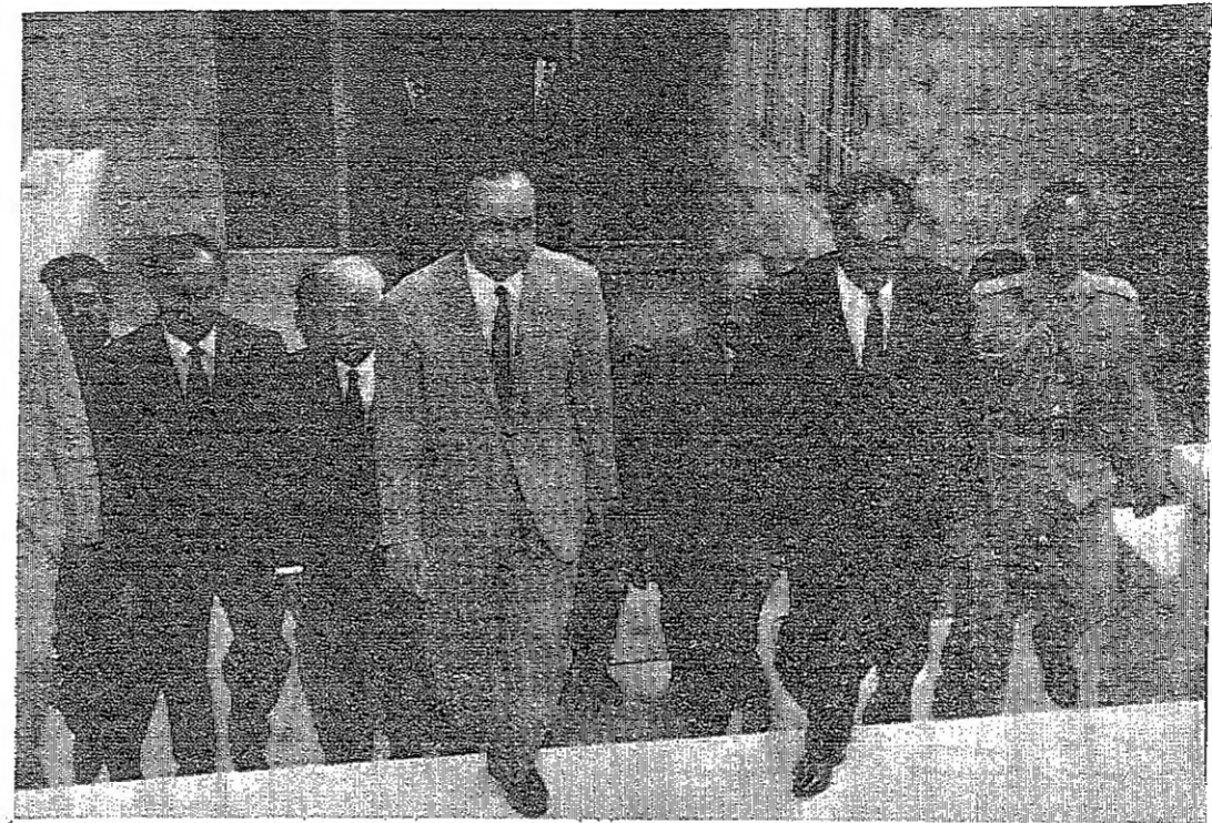
السيد عبد الحميد الكوش رئيس وزراء ليبيا في طريقه لحضور حفلة الغداء التي اقيمت على شرفه في معهد العمليات بمجلون يوم امس الاول بحضور عدد من الوزراء والسفير اريد